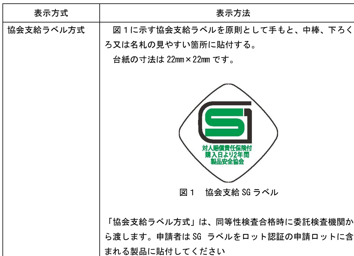
表 1 2 : ロット認証の SG マーク表示方法