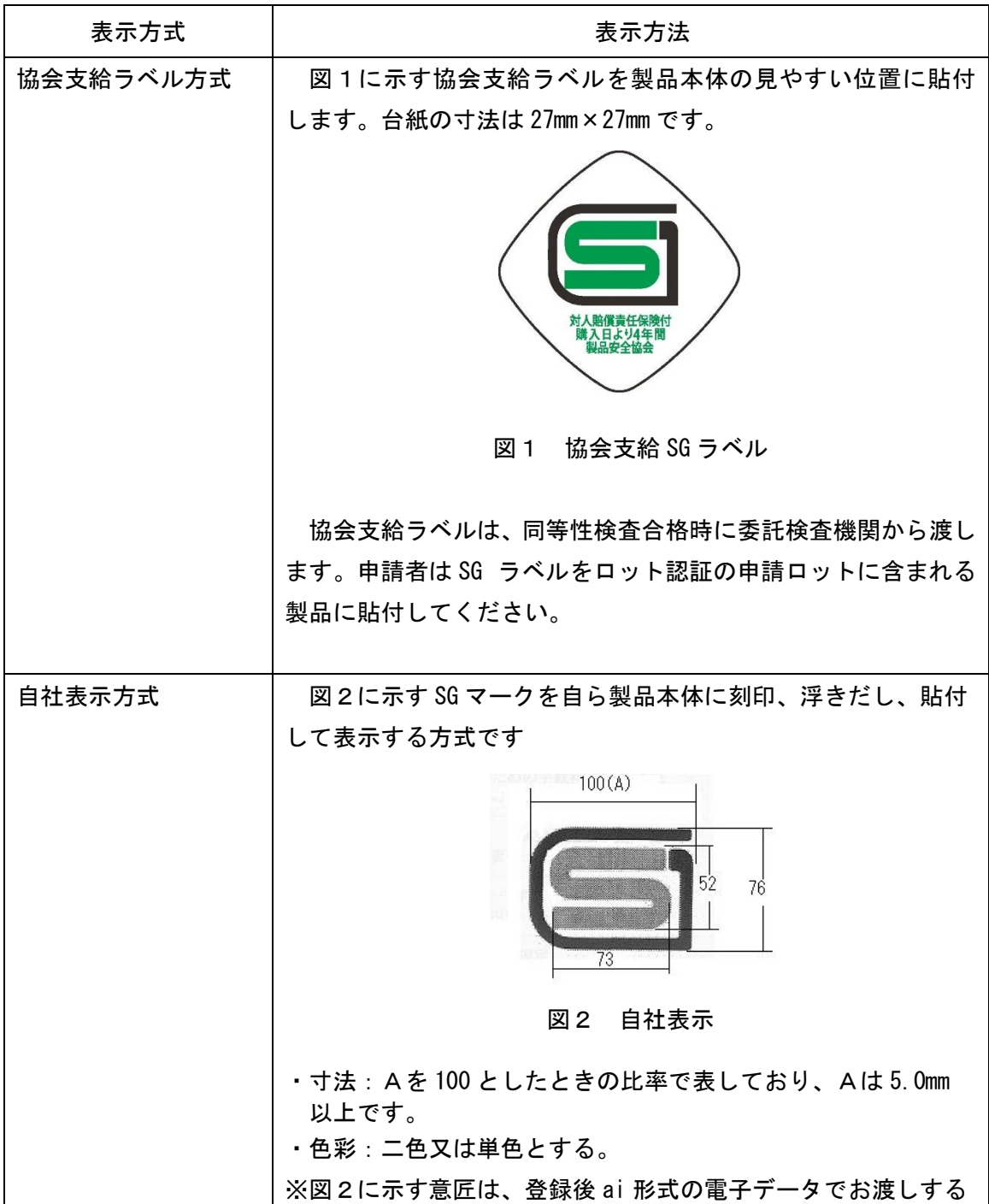
表 1 2 : ロット認証の SG マーク表示方法