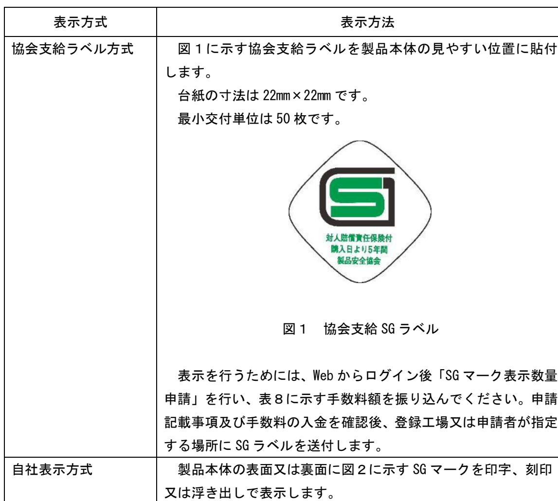
表 7 : 工場登録・型式確認の SG マーク表示方法